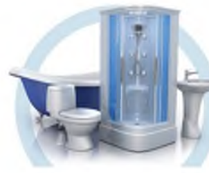
ТУАЛЕТ (УНИТАЗ, ВАННА, ДУШЕВАЯ КАБИНА, БИДЕ)