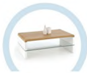
ЖУРНАЛЬНЫЕ СТОЛИКИ И ПРОЧИЕ ЖЕСТКИЕ ПОВЕРХНОСТИ