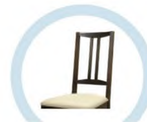
СПИНКИ СТУЛЬЕВ, НЕ ОБИТЫЕ ТКАНЬЮ И МЯГКИМ ПОРИСТЫМ МАТЕРИАЛОМ