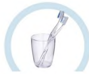
ТУАЛЕТНЫЕ ПРИНАДЛЕЖНОСТИ (ЗУБНЫЕ ЩЕТКИ, РАСЧЕСКИ И ПР.)